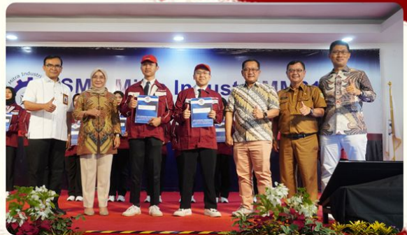
Pelepasan Peserta Ausbildung Jerman oleh Direktorat Jenderal Pendidikan Vokasi