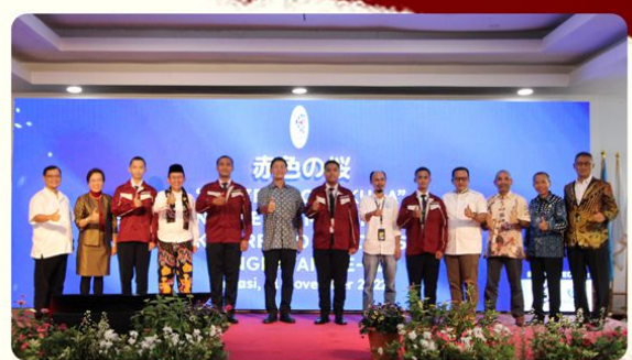
Pelepasan Peserta Magang Jepang oleh Kemenaker dan Bupati Bekasi