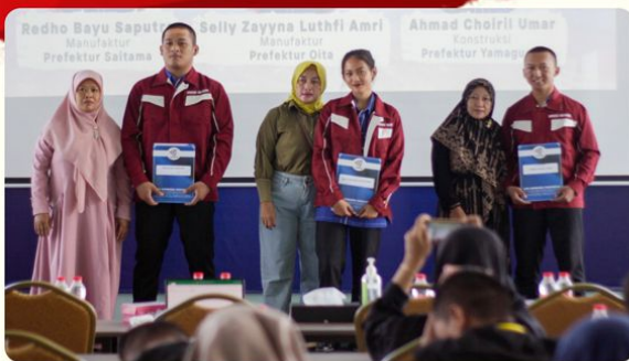
Pelepasan Peserta Magang Jepang oleh Disnaker Kabupaten Pati