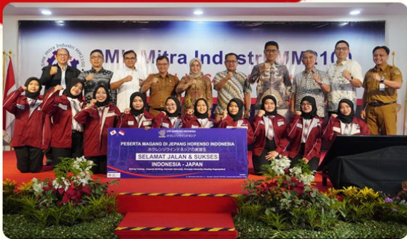
Pelepasan Peserta Magang Jepang oleh Direktorat Jenderal Pendidikan Vokasi

Managed by SMK Mitra Industri MM2100 Bekasi