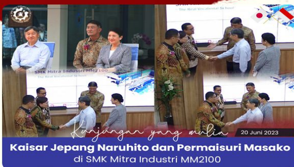
Kunjungan Kaisar Jepang dan Permaisuri di SMK Mitra Industri MM2100