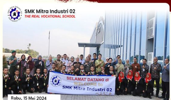
Kunjungan Menteri Ketenagakerjaan Republik Indonesia di SMK Mitra Industri 02